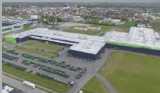
Neues DEUTZ-FAHR Traktorenwerk in Lauingen (Nähe München).