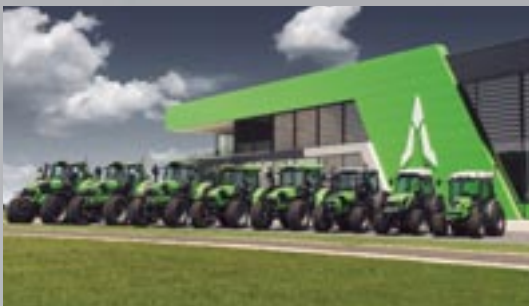
DEUTZ-FAHR Traktorenprogramm von 30 -340 PS (vor der neu errichteten DEUTZ-FAHR Arena).

Weitere Informationen finden Sie unter www.deutz-fahr.at DEUTZ